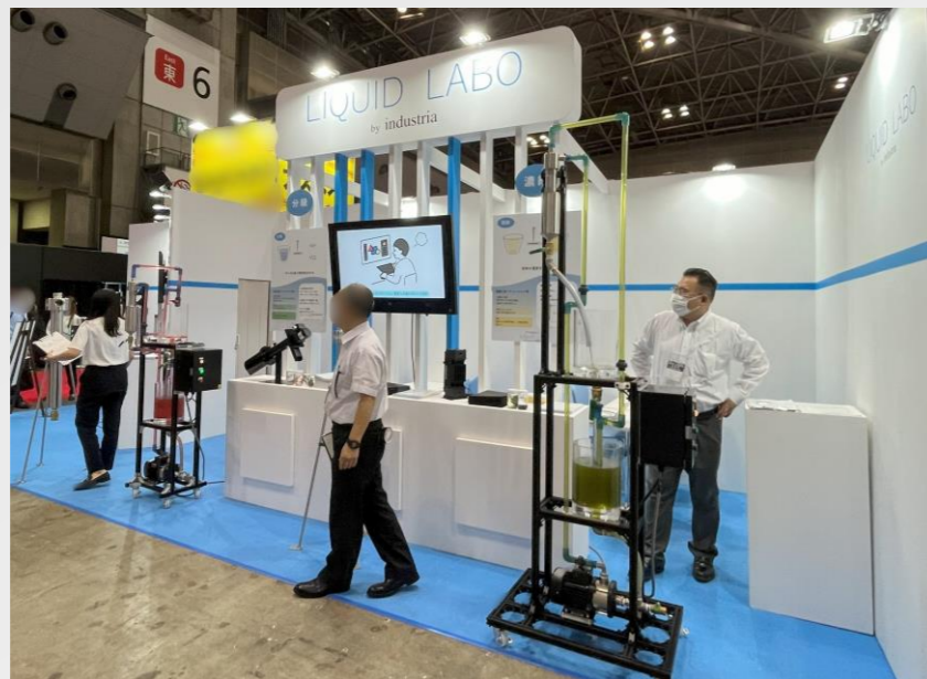
展示会ではお客様に直接ご説明します

それと、やっぱり、「相手が何をやりたいのか」を理解することが大事ですよ。こちらが言いたいことばかりを言っているような、一人よがりの取扱説明書というのは、分かりにくいんですよ。