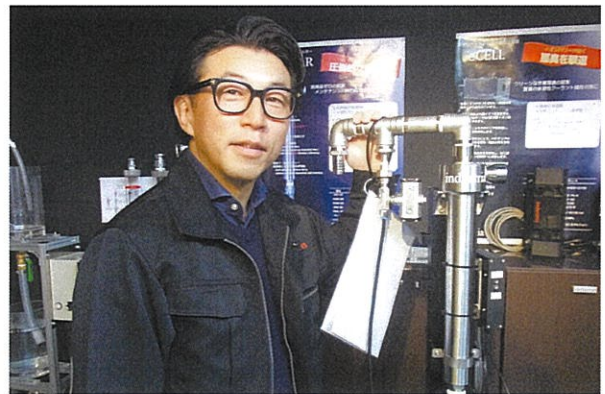
廃液処理装置「フルスター」は顧客の悩み事を受け、開発した